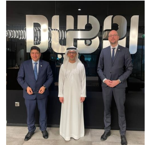
Abordnung aus den Ministerien in Sachsen und Baden-Württemberg sowie der Generalkonsulin, Besucher aus Aserbaidshan und Oman, Treffen mit dem Dubai Department of Economy and Tourism